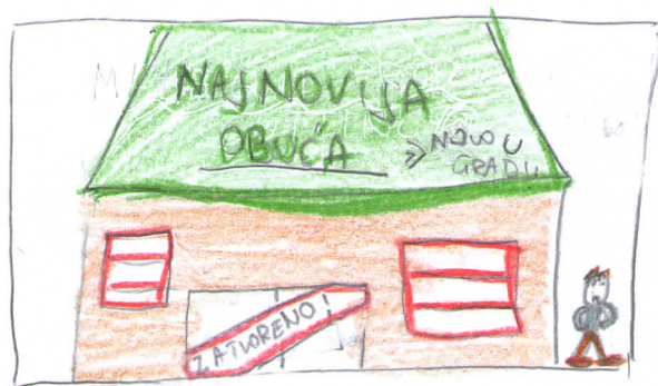
PROPADANJE MANJIH PODUZETNIKA